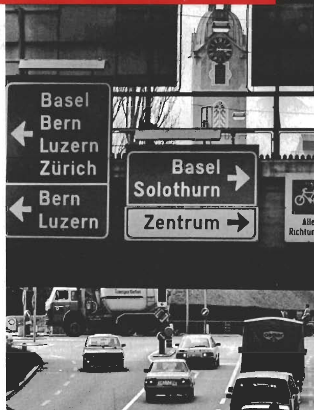
Wohin führt der Weg, wenn die Vorbereitung des Reformprojekts «Schulische Integration» weiterhin so chaotisch verläuft?

Lehrpersonen, deren Schule bisher noch nicht auf den Integrationszug aufgesprungen ist, schauen sorgenvoll und mit begründeten Bedenken in die Zukunft, da sie überhaupt nicht wissen, was sie erwartet. Die Liste solcher negativen Indikatoren liesse sich noch erweitern. Letztlich sind sie jedoch Ergebnis eines schlecht ausgeführ-