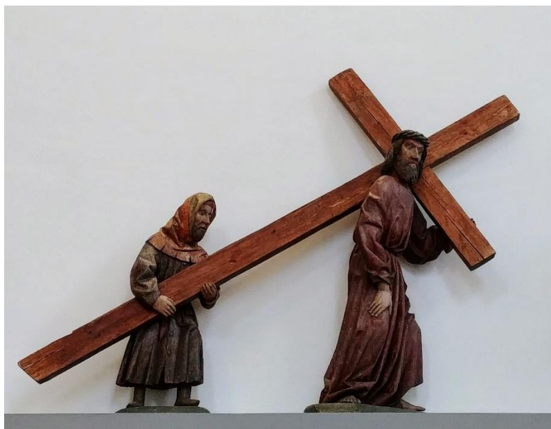
Alte Spitalkirche Solothurn

In diesem Sinne machen wir uns auf den Weg, Ostern entgegen, im Wissen, dass wir die Last der Welt nicht auf unseren Schultern tragen können und müssen.