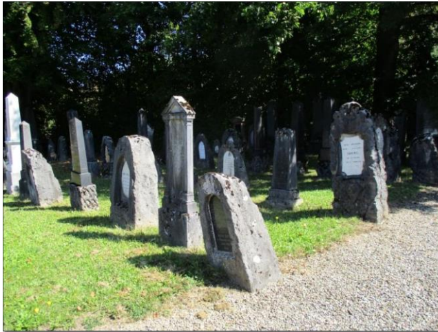
Jüdischer Friedhof Bern

Der Anlass findet am Mittwoch, 22. Mai 2024 (nachmittags) statt. Ein detaillierte Flyer dazu folgt.