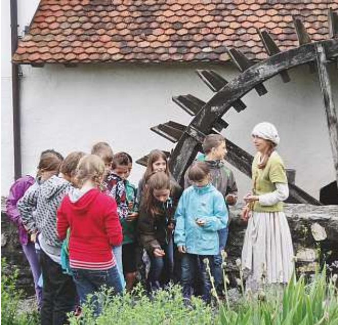
Kinder können auf Schloss Hallwyl vieles entdecken, bestaunen und selber erleben.