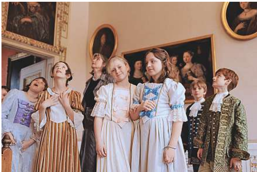
Da fühlt man sich in die vergangene Zeit zurückversetzt.

Unterlagen zur Verfügung, die vom Kindergarten weg bis in die 6. Klasse äusserst nützliche Dienste leisten. Die museumspädagogischen Unterlagen sind online auf der Website des Schlosses Waldegg ( www.schloss-waldegg.so.ch ) mit einem entsprechenden Einleitungstext verfügbar: http://schloss-waldegg.so.ch/de/angebote/materialien-fuer-lehrpersonen/ .