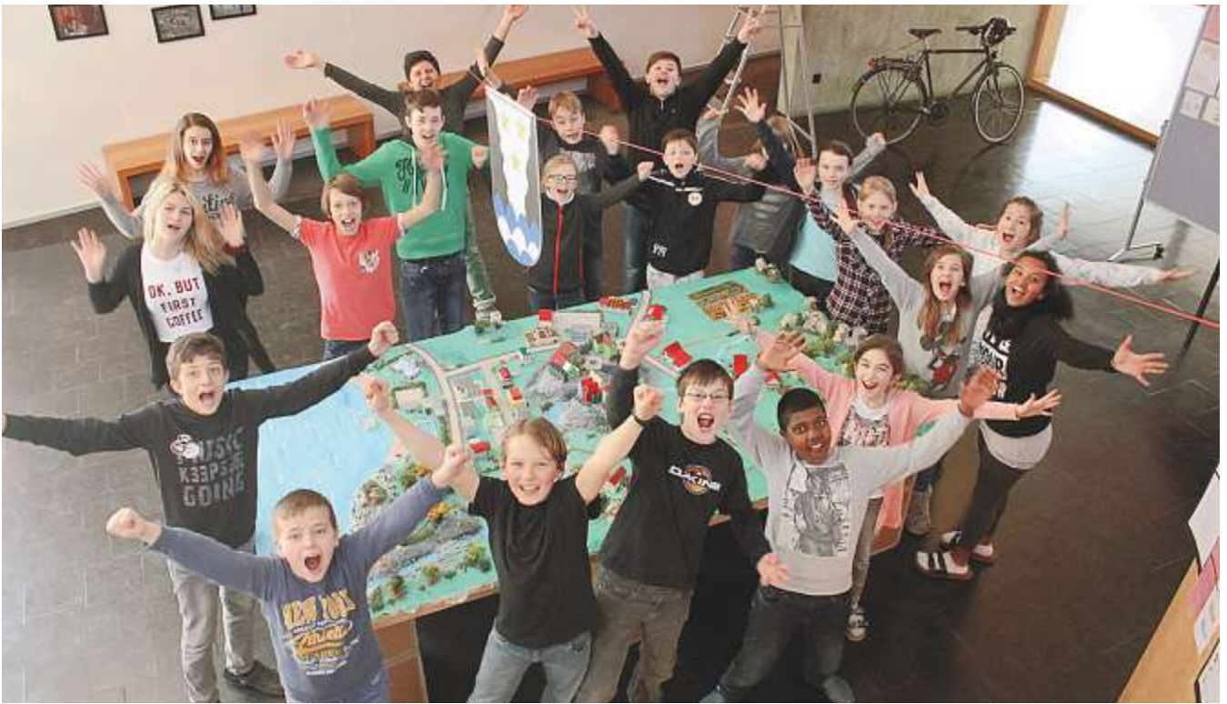
Die Gemeinde Felsikon ist gebaut: Es ist geschafft!