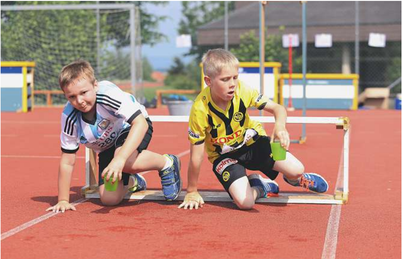
Der UBS Kids Cup beinhaltet die Grundbewegungsformen «Laufen, Springen und Werfen».