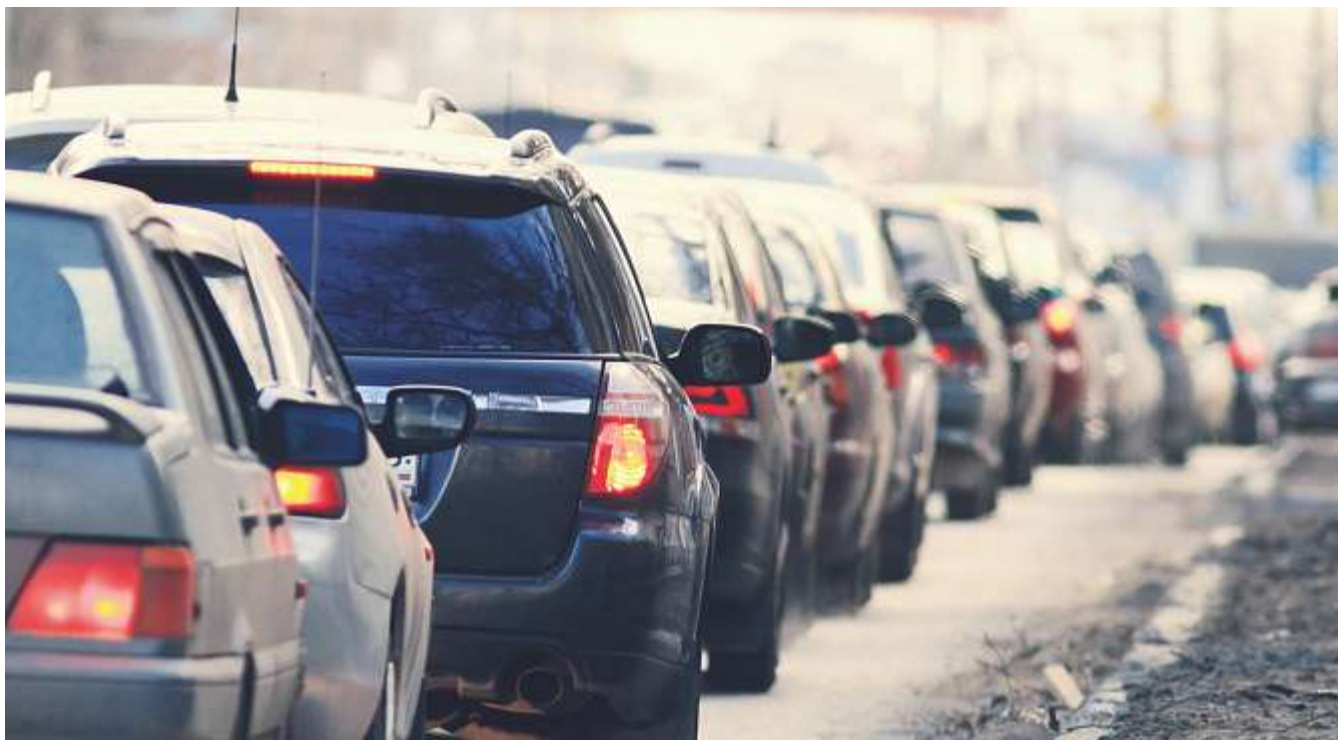
Gelder aus der Mineralölsteuer nur noch für den Strassenbau: Wird die «Milchkuh»-Initiative angenommen, fehlen der Bildung Millionenbeträge. Foto: Fotolia.

GL LCH. Der Abstimmungssonntag vom 5. Juni hat es in sich: Nicht nur, dass bedeutende kantonale Vorlagen entschieden werden müssen (etwa die alv-Initiative zur familienergänzenden Kinderbetreuung), sondern auch wesentliche eidgenössische Vorlagen stehen zur Entscheidung an.