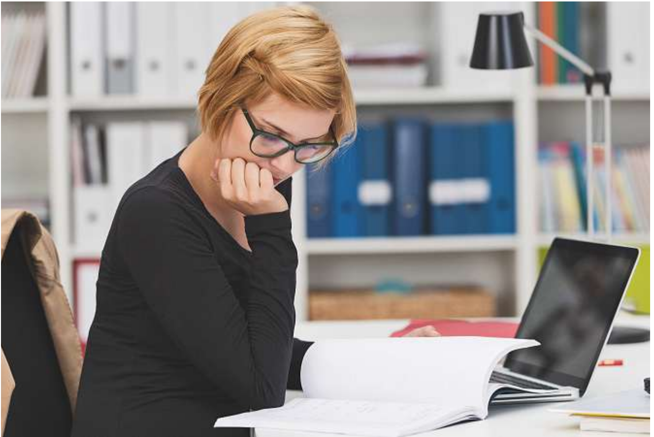
Online-Tests: Die Nutzung von Hilfsmitteln im Internet ist noch ein Knackpunkt.