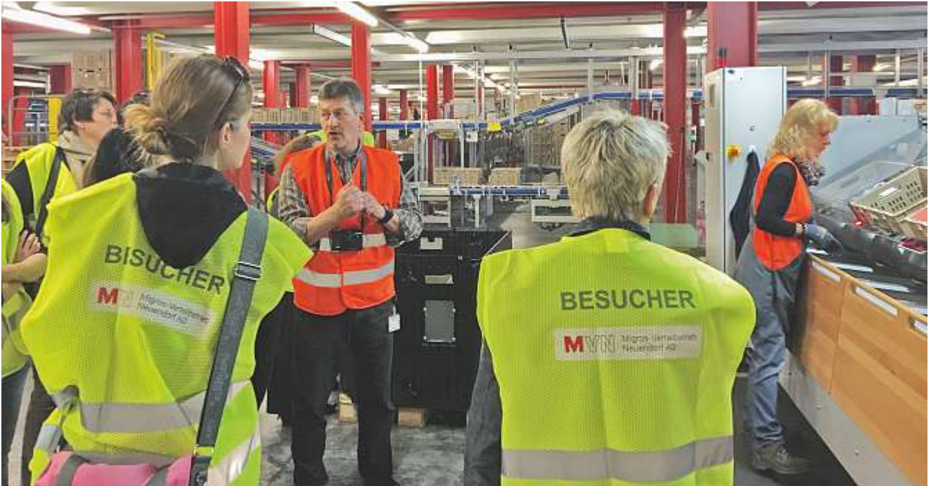
Weiterbildung am Ort einer möglichen Lehre für acht Berufe: Die Lehrpersonen der Kreisschule Gäu.

Weiterbildungstag Kreisschule Gäu. Die Kreisschule Gäu (KS Gäu) veranstaltete am 6. April mit der Unterstützung des Vereins «Jugend und Wirtschaft» und des Kantonal Solothurnischen Gewerbeverbands (KGV SO) einen schulinternen Weiterbildungstag. Ein Ziel war unter anderem die konzeptorientierte Gestaltung des Berufswahlunterrichts.