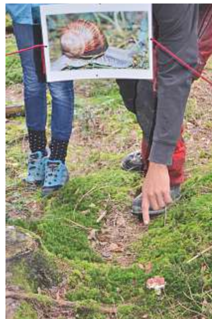
Die Pädagogische Hochschule lädt zum Tag der Biodiversität ein.

Programm und Anmeldung bis 10. Mai auf: www.fhnw.ch/ph/tagungen/biodiversitaet Ausstellung «Naturnahe Schulumgebungen» bis 2. Juni, Mediothek PH FHNW Solothurn