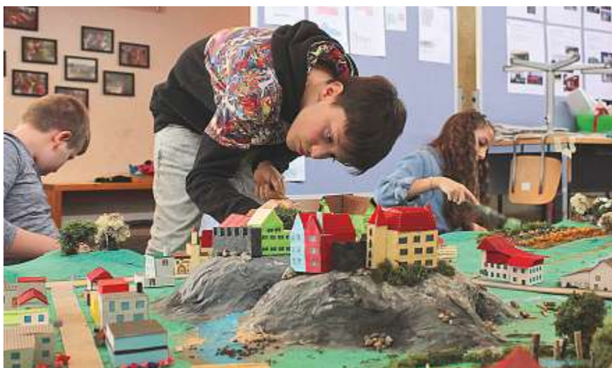
Letzter Feinschliff vor der grossen Eröffnungsfeier.