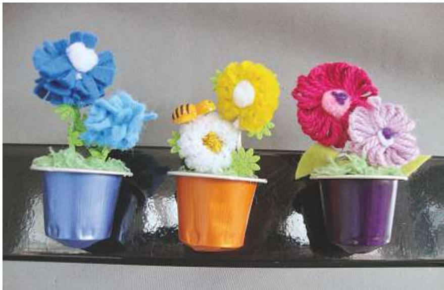
So sehen die Blumentöpfe am Schluss aus.

Da es unzählige Möglichkeiten gibt, Blumen herzustellen, eignet sich diese Arbeit