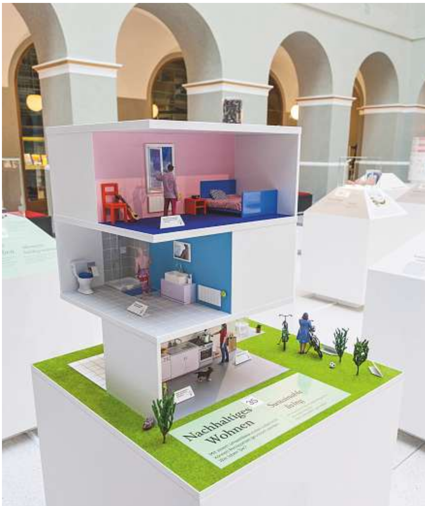
Alle Aspekte von Rohstoffen werden beleuchtet – hier die Verwendung im Hausbau.

Die Sonderausstellung ist vom 31. Mai bis 18. Juni geschlossen.