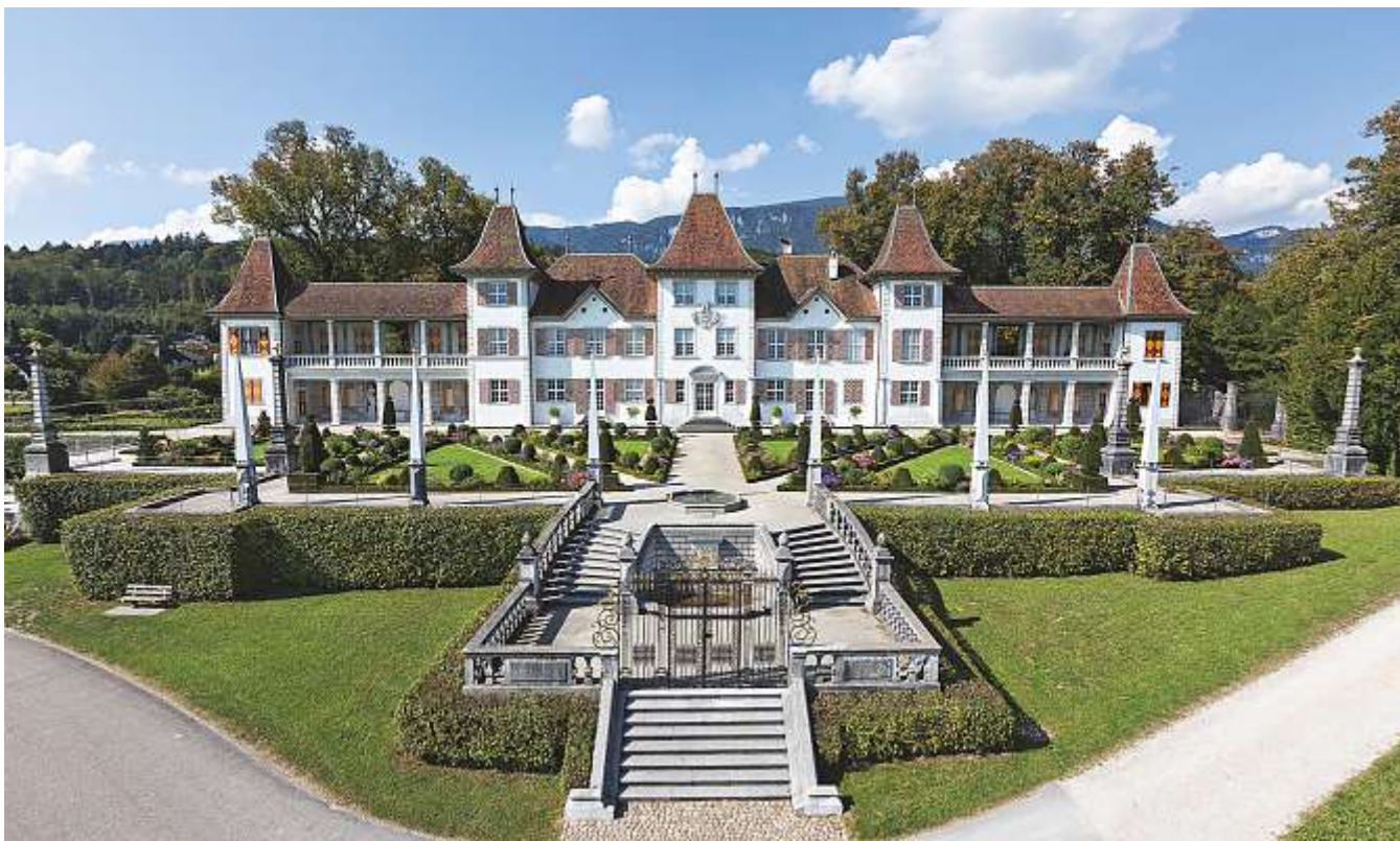
Das Schloss Waldegg ist ein ideales Lernfeld.