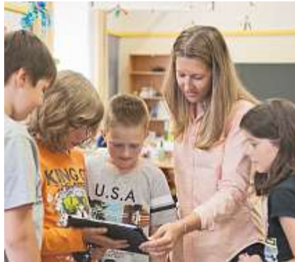
Die neuen Plattformen bieten Lehrpersonen Orientierung und Unterrichtsideen zum Thema Medien und Informatik.

Die Plattformen mi4u.ch (AG) und ict-regelstandards.ch (SO) erlauben unterschiedliche Zugänge zur Thematik. Aktuell stehen über 60 erprobte Unterrichtsideen zur Verfügung, die sich nach Stufen oder Fächern filtern lassen. Einzelne Ideen regen an, die Aufgabenstellungen der Lehrmittel wie «Die Sprachstarken» oder «Das Zahlenbuch» mit digitalen Medien umzusetzen oder zu erweitern. Andere Ideen zeigen auf, wie Computer und Tablets im Bereich des Gestaltens eingesetzt oder das Verständnis für Grundlagen der Informatik gefördert werden können. Allen Ideen gemein ist der handlungsorientierte Ansatz. Ausgehend von konkreten Tätigkeiten mit digitalen Medien regen Reflexionsfragen zum Nachdenken über die Medienwirkung oder zum Ver-