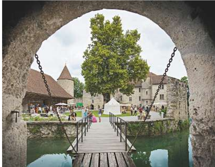
Der imposante Burggraben von Schloss Hallwyl weckt Erinnerungen an vergangene Belagerungen.

Burgleben. Wie haben unsere Vorfahren vor 650 Jahren gelebt? Wie lief eine Burgbelagerung im Mittelalter ab? Auf Schloss Hallwyl können Schülerinnen und Schüler der 4. bis 6. Klasse in zwei abwechslungsreichen Workshops das mittelalterliche Burgleben erkunden.