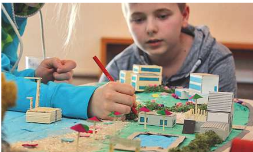
Mit viel Fingerspitzengefühl wird gezeichnet.