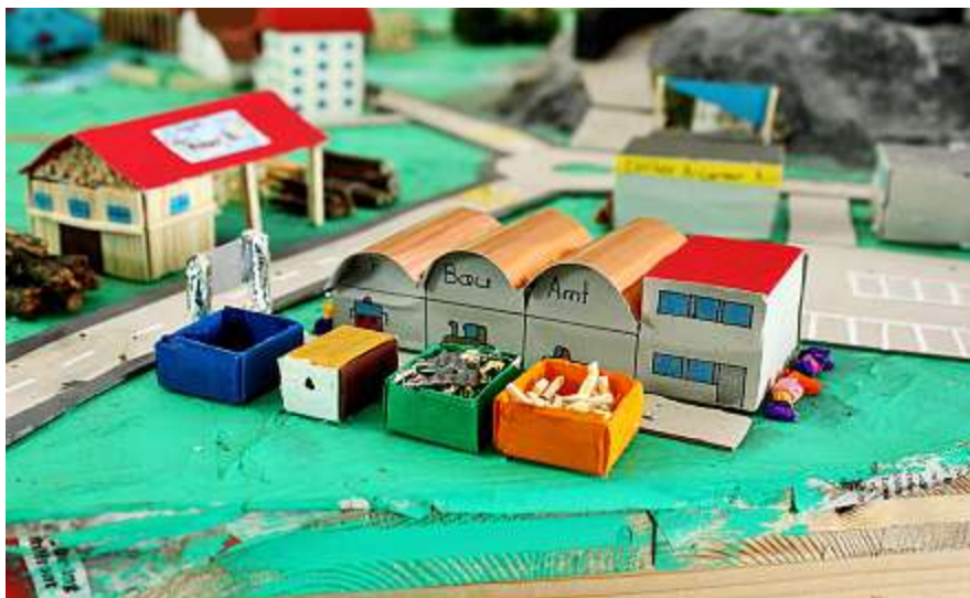
Mit viel Liebe zum Detail: Das Bauamt in Felsikon.