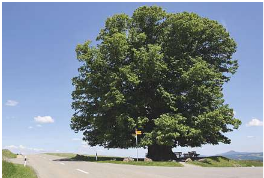
Die Linner Linde ist eine der Attraktionen.