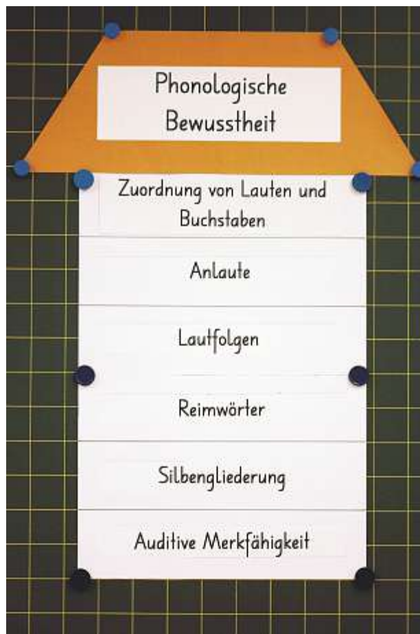
Phonologische Bewusstheit, bildlich dargestellt.