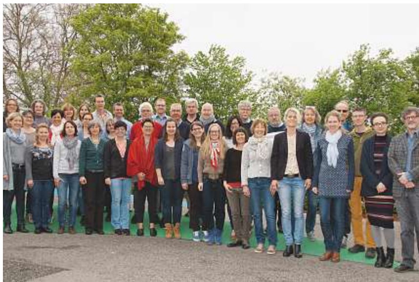
«Ewige Freude»: In diesem Zeichen steht das Konzert von Pro Musica Vocale.

► 30. Mai bis 5. Juni Ein lokales Gipfeltreffen für saubere Energie, Gruppengespräche zu verantwortungsbewusstem Konsum, eine Tauschbörse für nachhaltige Produkte: Ideen für Klassen- oder Schulprojekte im Rahmen der Europäischen Nachhaltigkeitswoche vom 30. Mai bis 5. Juni sind rasch gefunden. Wichtig sind der Bezug zu einem oder mehreren der 17 Nachhaltigkeitsziele, die in der UNO-Agenda 2030 formuliert sind und eine aktive Kommunikation rund um das Vorhaben. Weitere Informationen unter: www.education21.ch/de/news/europaeische-nachhaltigkeitswochesdw2018 .