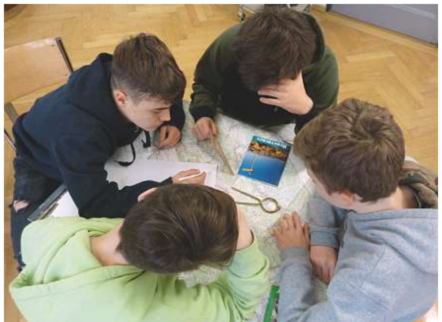
Die mehrtägige Wanderung in die Romandie – ohne Erwachsene – will sorgfältig geplant sein.