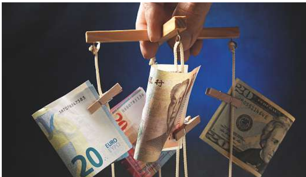
Hier (zu) viel, dort zu wenig: das Thema Geld dominierte die Verbandsratssitzung.