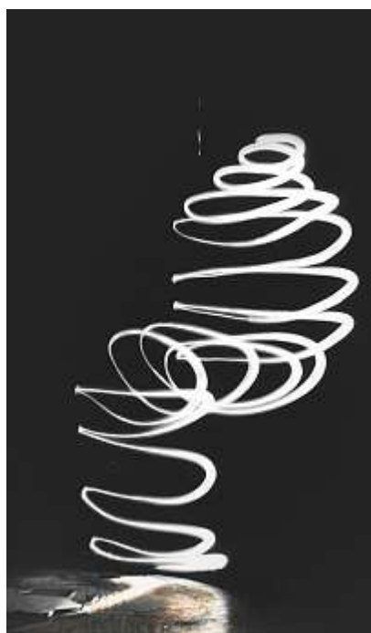
Bruce Nauman, Light Trap for Henry Moore No. 1, 1967. Schwarz-Weiss-Fotografie, 157,5 × 105,7 cm. Glenstone Museum, Potomac, Maryland, Foto: Alex Jamison, © Bruce Nauman / 2018, ProLitteris, Zurich.

► bis 26. August, Schaulager Basel Präsentiert wird das gesamte mediale Spektrum des 1941 geborenen amerikanischen Künstlers: Es reicht von frühen Film- und Videoperformances über Zeichnungen, Druckgrafiken, Fotografien, Skulpturen und Neonarbeiten bis hin zu raumgreifenden Installationen. Zur Ausstellung bietet das Schaulager ein attraktives Kunstvermittlungsprogramm an. Die Führungen und Workshops richten sich an Schülerinnen und Schüler aller Altersstufen sowie an Studierende. www.schaulager.org