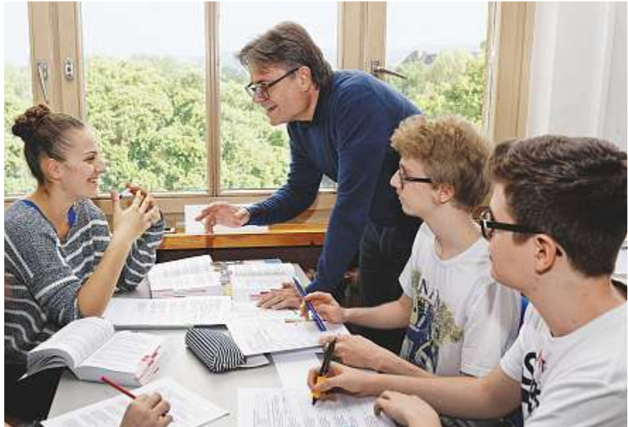
Ergebnisse der «WiSel»-Studie zeigen wirksame Indikatoren des Berufswahlunterrichts auf. Foto: André Albrecht (Themenbild).

In unserem grossen, laufenden Forschungsprojekt «Wirkungen der Selektion» (WiSel), in welchem rund 1500 Jugendliche aus vier Kantonen vom 5. Schuljahr bis zum 1. Jahr nach Schulaustritt begleitet werden, analysierten wir auch die Wirksamkeit des Unterrichts zur beruflichen Orientierung. Folgende Unterrichtsmerkmale spielen eine Rolle: (1) Es werden «Aktivitäten im Unterricht» initiiert, beispielsweise Schnupperlehren besprechen, Geschlechterverhalten diskutieren, Bewerbungen schreiben, Vorstellungsgespräche üben, und anderes.