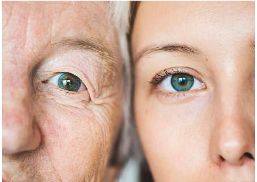
Kinder, Jugendliche und junge Erwachsene betreuen pflegebedürftige Angehörige: Dieses Phänomen ist noch wenig erforscht.

«In der Schweiz kümmern sich knapp acht Prozent der Kinder, Jugendlichen und jungen Erwachsenen um erkrankte oder beeinträchtigte Familienangehörige oder nahestehende Personen», schreibt Careum Forschung. Trotz dieses relativ hohen Prozentsatzes kannten von den 3518 befragten Fachpersonen 56 Prozent keine Fachbegriffe zur Beschreibung pflegender und betreuender junger Menschen. 44 Prozent waren mit den Begriff-