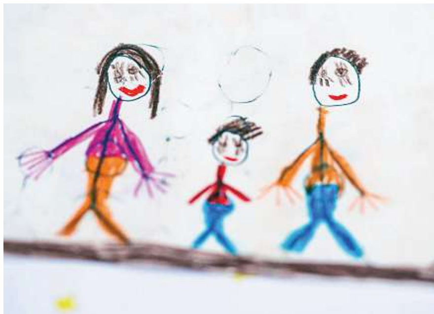
Kinderzeichnung zum Thema Paargewalt.