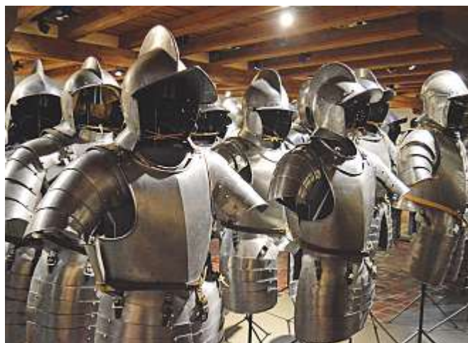
Der jährliche Ausflug führte die SCHULBLATT-Verantwortlichen und Mitarbeitenden ins Alte Zeughaus nach Solothurn. Manch eine(r) war froh, die kriegerischen Geräte und Rüstungen nur anschauen zu dürfen.