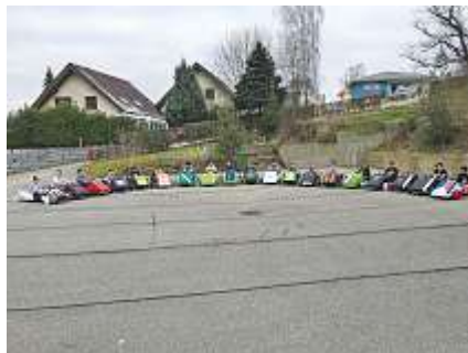
Die Seifenkisten sind fertig! Gruppenbild mit Wagenpark.

das. Mit Aufräumarbeiten, ersten kleinen Fahrerlebnissen und einem Gruppenbild mit Wagenpark ging die Woche zu Ende. Für einige lange Gesichter sorgte die Tatsache, dass die Konstrukteure ihre Seifenkisten noch nicht mit nach Hause nehmen konnten. Bis zum Rennen sollen die Fahrzeuge gut erhalten bleiben und durch den Verantwortlichen noch einmal auf ihre Fahrtauglichkeit überprüft werden können. Trotzdem: In einem kurzen schriftlichen Feedback gaben alle Teilnehmer an, diese aussergewöhnliche Woche hätte ihnen grossen Spass bereitet.