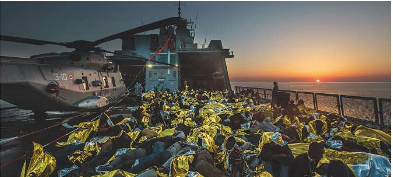
An Bord eines Schiffs der Operation «Mare Nostrum»: Von hier aus wurden mehr als 100 000 Menschen aus dem Mittelmeer gerettet.