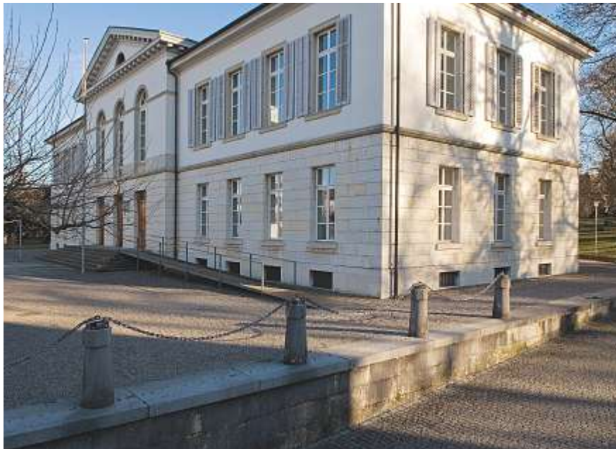
Hier wird Politik gemacht: Das Grossratsgebäude in Aarau.

Eine überparteiliche Motion der bürgerlichen Parteien GLP, CVP, EVP, FDP und SVP möchte die Gleichbehandlung von Schülerinnen und Schülern von bewilligten Privatschulen beim Mittelschulübertritt gegenüber Bezirksschülerinnen und -schülern der Volksschule. Im Schulgesetz solle die Möglichkeit geschaffen werden, die Privatschulen so anerkennen zu las-