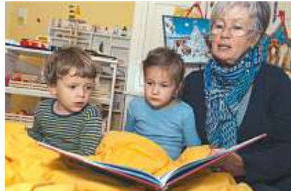
Ob zu Hause oder in der Schule, das Vorlesen vergrössert unter anderem den Wortschatz.

« Vorlesen ist die einfachste und wirksamste Form der Leseförderung. »