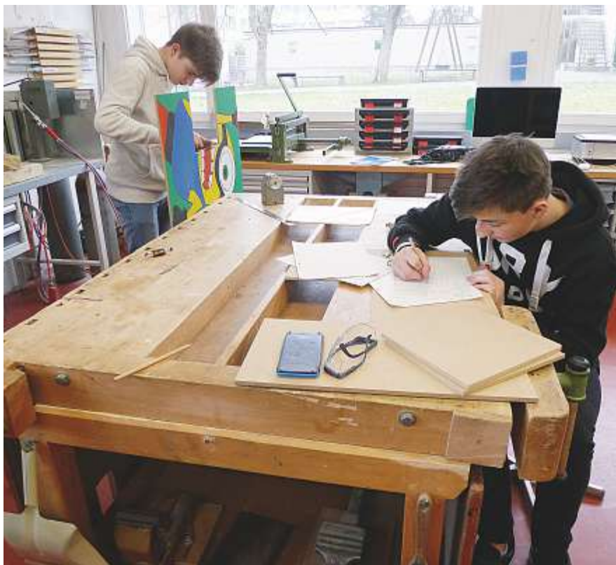
Im Fach «Projekte und Recherchen» können Jugendliche ein selbstgewähltes Vorhaben von A bis Z realisieren: Das «Modellhaus» nimmt Gestalt an.

Die Mädchengruppe, die eine Talentshow auf die Beine stellt, ist überzeugt, dass ihnen etwas Grossartiges gelingen werde und sie nimmt dafür viel Arbeit in Kauf. «Wir haben ein gemeinsames, selbstgewähltes Ziel und das macht uns Spass. Die Zusammenarbeit läuft gut, obwohl die Lehrpersonen zuerst überzeugt werden mussten, dass wir zu fünf ein Projekt verwirklichen können. Die Arbeitsteilung ist klar geregelt, trotzdem können wir uns gegenseitig gut unterstützen und beraten». Was sie lernen? Zum Beispiel eine detaillierte Planung und Budgetierung des Anlasses: von der Suche nach Sponsoren bis zur Organisation des Caterings und zur Herstellung einer attraktiven Saaldekoration. Welche Stolpersteine gibt es? «Dass wir zuerst eine genaue Planung machen mussten und nicht sofort umsetzen konnten, war schwer auszuhalten. Wir schrei-