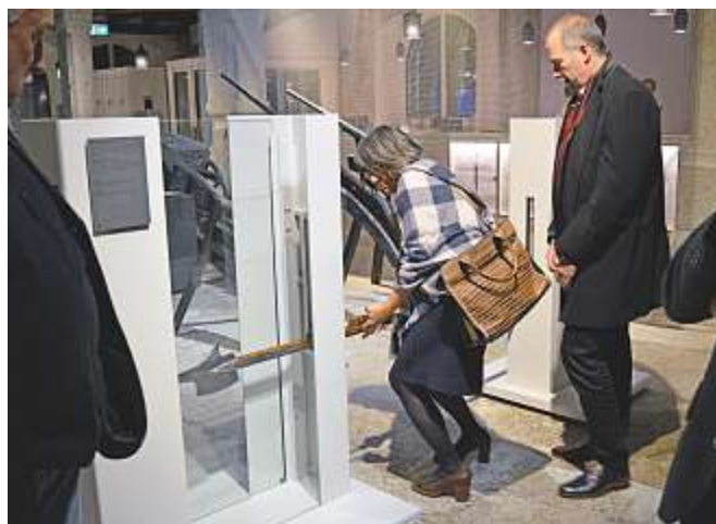
Nur diese kleine Ritterrüstung darf berührt werden – die Glanzstellen verraten, dass davon im Museum auch Gebrauch gemacht wird.

zu erleben. Beim anschliessenden Abendessen in der Altstadt von Solothurn konnten die Mitarbeiterinnen und Mitarbeiter des SCHULBLATTs, die sich sonst eher selten persönlich treffen, Gedanken austauschen und den Abend geniessen.