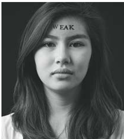
«Gestempelte Jugendliche».

Ein strahlendes Lächeln, ein böser Blick oder ein beleidigter Schmolle Mund – unser Gesicht kommuniziert ohne Worte. Wir werden verstanden, missverstanden, geliebt oder abgewiesen und schlüpfen in verschiedene Rollen. Das Erkennen und Interpretieren von Gesichtern und Gesichtsausdrücken ist eine grundlegende Fähigkeit von uns Menschen. Das Historische Museum Baden lädt Schülerinnen und Schüler zu einem Spiel mit Augen, Nase und Mund ein. Computergeneriert können sie zuschauen, wie sich ihr Gesicht im hohen Alter zeigen wird. Mit einfachen Tipps und Tricks werden sie dazu angeleitet, selber ein Gesicht zu malen. Der Lehrer Peter Marti kuratierte die auf Schulklassen zugeschnittene, partizipative Ausstellung für das Museum.BL in Liestal. Für das Historische Museum Baden standen zusätzlich Oberstufenschülerinnen und -schüler aus Baden Modell. Sie äussern sich über die Wichtigkeit und die Bedeutung des Aussehens – bei sich und bei anderen. In den auf jede Schulstufe abgestimmten Workshops erfahren die Lernenden mehr über die Kommunikation mit Mimik und Gestik. In Begleitung der Theaterpädagogin spielen sie Szenen