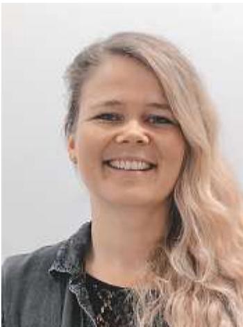
Flurina Rösli sieht vor allem Vorteile mit der neuen Ressourcierung.

Die Zuteilung der Lehrpensen – sogenannten Ressourcen – an die Schule vor Ort geschieht aktuell in einem komplexen System. Es existiert eine Vielzahl von verschiedenen zweckgebundenen Ressourcenarten, die unterschiedlich gesteuert werden. Der Kanton Aargau will diese historisch gewachsene Struktur ablösen. Mit einer vermehrt auf Pauschalen basierenden Ressourcierung sollen die Abläufe vereinfacht sowie der Handlungsspielraum erhöht werden. Die Schule Brittnau zählt zu den insgesamt elf Schulen, die in einem Schulversuch seit dem Schuljahr 2016/17 erste Erfahrungen mit einer neuen Ressourcierung sammeln.