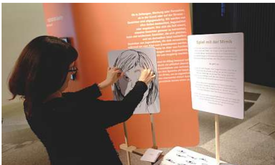
Eine Besucherin spielt mit der Mimik.

Kosten: Führung à 1 Std. 110 Franken, Workshop à 2 Std. 170 Franken oder à 3 Std. 220 Franken (mit Impulskredit von «Kultur macht Schule» zum halben Preis: 55, 85, 110 Franken).