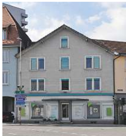
Die Praxis von Markus Seitz befindet sich an der Bahnhofstrasse in Derendingen.

kosten für die Beratungsstelle, die zu zwei Dritteln vom Kanton und zu einem Drittel vom LSO getragen werden, erheblich geringer aus.