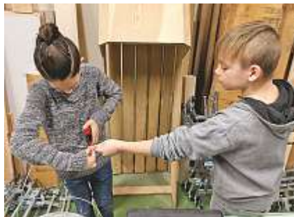
Bei der konkreten Arbeit unterstützten sich die Schüler gegenseitig.