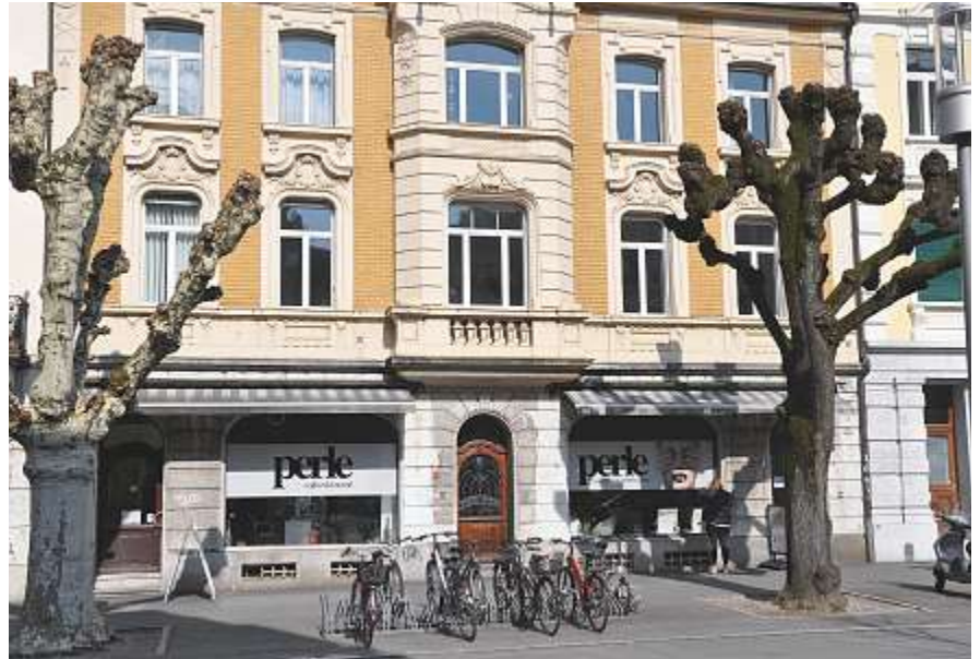
Regula Blöchliger ist an der Hauptbahnhofstrasse 5 in Solothurn erreichbar.

Gegenüber dem Vorjahr fiel der zeitliche Aufwand geringer aus und lag deutlich unter dem 10-Jahres-Durchschnitt. Die Verteilung von Telefonberatungen, Einzel- oder Zweierberatungen und Gruppenberatungen lag analog zu den vergangenen Jahren im Durchschnitt. Einzel- und Zweierberatungen nehmen nach wie vor den grössten Platz ein. Entsprechend des zeitlichen Aufwands fielen die Gesamt-