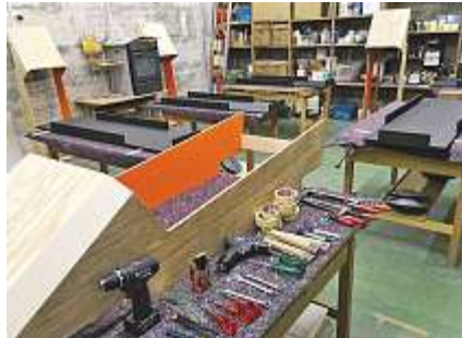
Vor Arbeitsbeginn war die Ordnung bei den Werkzeugen beeindruckend.

Die Schwerpunkte am Dienstag und Mittwoch lagen bei der farblichen Gestaltung der Kisten und Felgen. Drei Lehrpersonen unterstützten den Werklehrer und die Teilnehmenden abwechselnd während dieser Woche, sodass die Schüler an jedem Tag ausreichend begleitet wurden. Ab Mittwoch begann die Montage der Stahlteile: Achsen, Lenkvorrichtung, Sitze und die Bremsen. Da wurde gemessen, ausgerichtet, gebohrt, geschraubt, befestigt, justiert. Bis Freitagmittag sollten alle Rennfahrzeuge grundsätzlich fertig sein. Dank gegenseitiger Unterstützung und gutem Einsatz klappte